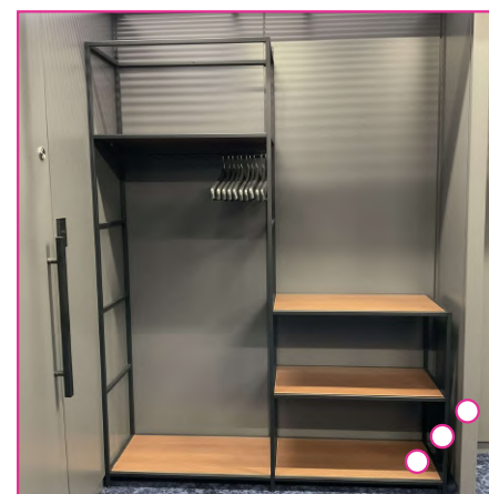
○ ROOM A ○ ROOM B北 ○ 荷物置き場 ○ ドア ○ コンセント